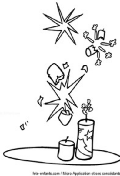
lele-enfants.com / Micro Application et ses concédants